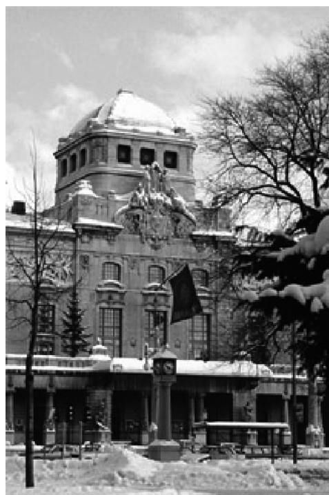
Dramaten i Stockholm.

Steg ett var som brukligt offentliggörandet av de nominerade böckerna. På den inte alltför mediabesökta presskonferensen fick de nominerade författarna sina Augustdiplom. Dessa hade tidigare brukat delas ut vid själva prisceremo-